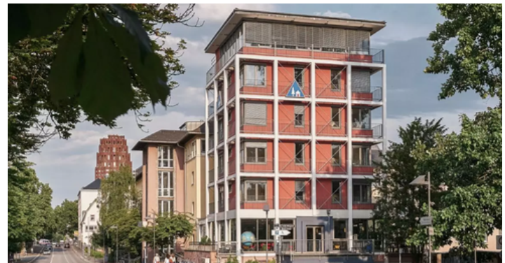
Jugendherberge Frankfurt am Main

Während des Seminars übernachten wir in der Jugendherberge Frankfurt , Haus der Jugend, Deutschherrnufer 12, 60594 Frankfurt am Main . Dort wird auch unser Programm stattfinden. Vegetarisches Frühstück, Mittag- und Abendessen werden vom Haus zur Verfügung gestellt. Wenn du dich gerne vegan ernährst oder Allergien/Unverträglichkeiten hast, gib das bitte bei der Anmeldung an.