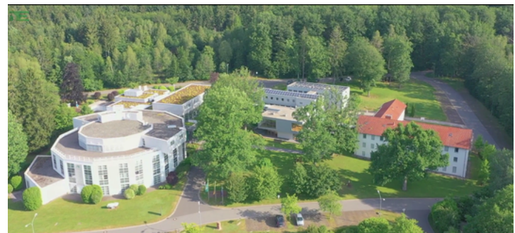
Europäische Akademie Otzenhausen